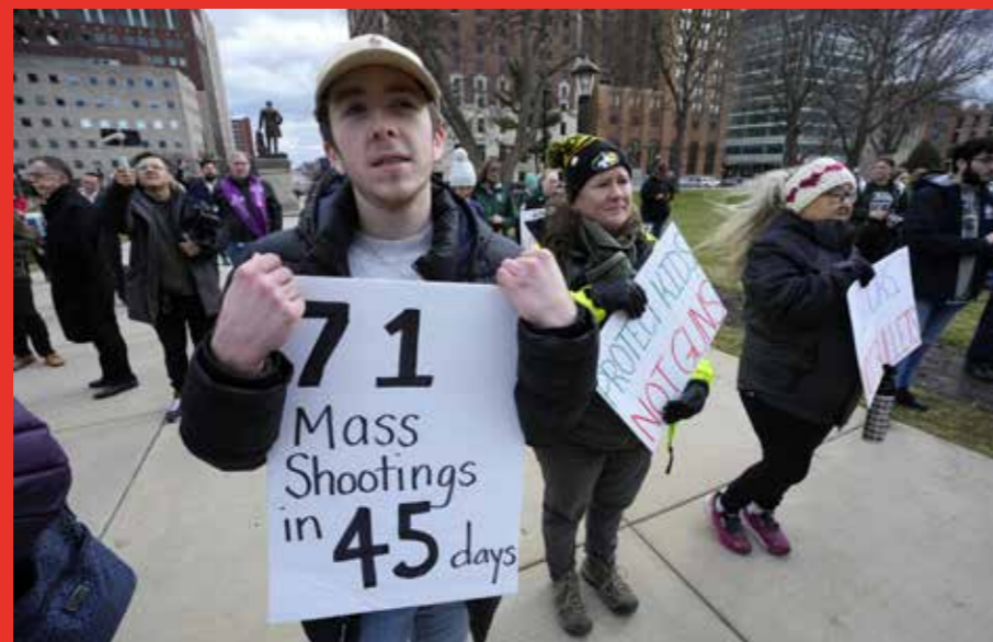
Op de grote foto ligt een slachtoffer van de schietpartij op de Columbine High School in 1999, aangericht door Eric Harris en Dylan Klebold (foto rechtsboven) die later zelfmoord zouden plegen (foto rechtsmidden). Foto linksonder: Dylan McNey die twee mass shootings overleefde. Foto onder: regelmatig wordt er in de VS geïmagineerd tegen de wapenwetten.

ze elkaar noemden, hebben het op de tapes over hun 'goddelijke status' en het feit dat ze 'boven normale mensen staan'. Ze bespreken welke leerlingen ze willen vermoorden en welke overlevenden ze zullen stalken als geest. Ze spreken de hoop uit om minstens 250 doden op hun naam te krijgen en laten de wapens zien die ze daarvoor willen inzetten. In de loop van een van de wapens staat 'Arlene' gekrast, Harris' bijnaam voor zijn shotgun. Nadien bleek dat beide jongens fans waren van Rammstein, KMFDM en de film Natural Born Killers .