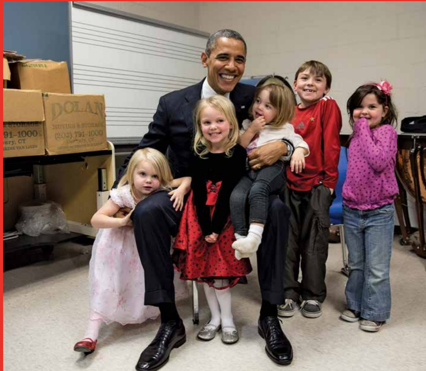
President Obama met familie van een van de omgekomen kinderen op de Sandy Hook Elementary School. Op de foto's daaronder: in Amerika is wapenbezit van alle leeftijden.