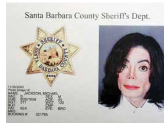
Met de klok mee: Jimmy Savile, Michael Jackson en R. Kelly.