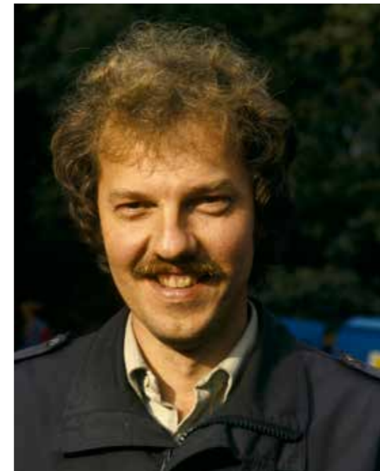
Met de klok mee: Jeffrey Epstein, Harvey Weinstein en Karst van der Meulen.