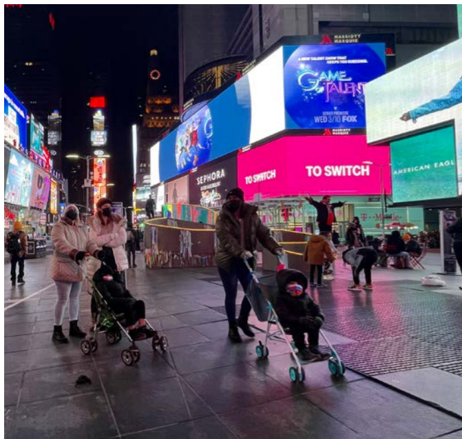
Foto linksonder: op Times Square is het alweer ietsje drukker. Foto rechtsonder: koelkasten voor gemeenschappelijk gebruik in The Bronx, dagelijks aangevuld door winkeliers en particulieren.

Het honkbalstadion van de Yankees is ingericht als vaccinatiecentrum.