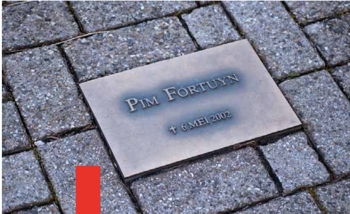
De plek op het Media-park waar Pim Fortuyn werd vermoord.

Levenloos, het bloed nog gutschend uit het hoofd en de mond halfopen. Zo viel Pim Fortuyn een week voor de geplande Tweede Kamerverkiezingen in mening huishouden op de deurmat. De Telegraaf besloot het vermoorde lichaam van de aanstaande premier – want zoveel was na de peilingen wel duidelijk – pontificaal op de cover te plaatsen en volgde daarmee de Volkskrant en het Algemeen Dagblad die hetzelfde deden.