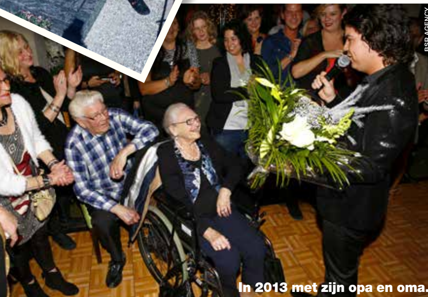
In 2013 met zijn opa en oma.

wel eens onze mond over dat soort verhalen als hij binnenkwam, omdat we zagen hoe moeilijk hij het had in zijn nieuwe rol.' Roy: 'Het ging allemaal zo snel. Ik werd een uur voor de communie