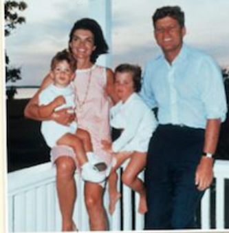
John en Jackie Kennedy met hun kinderen John Jr. en Caroline.