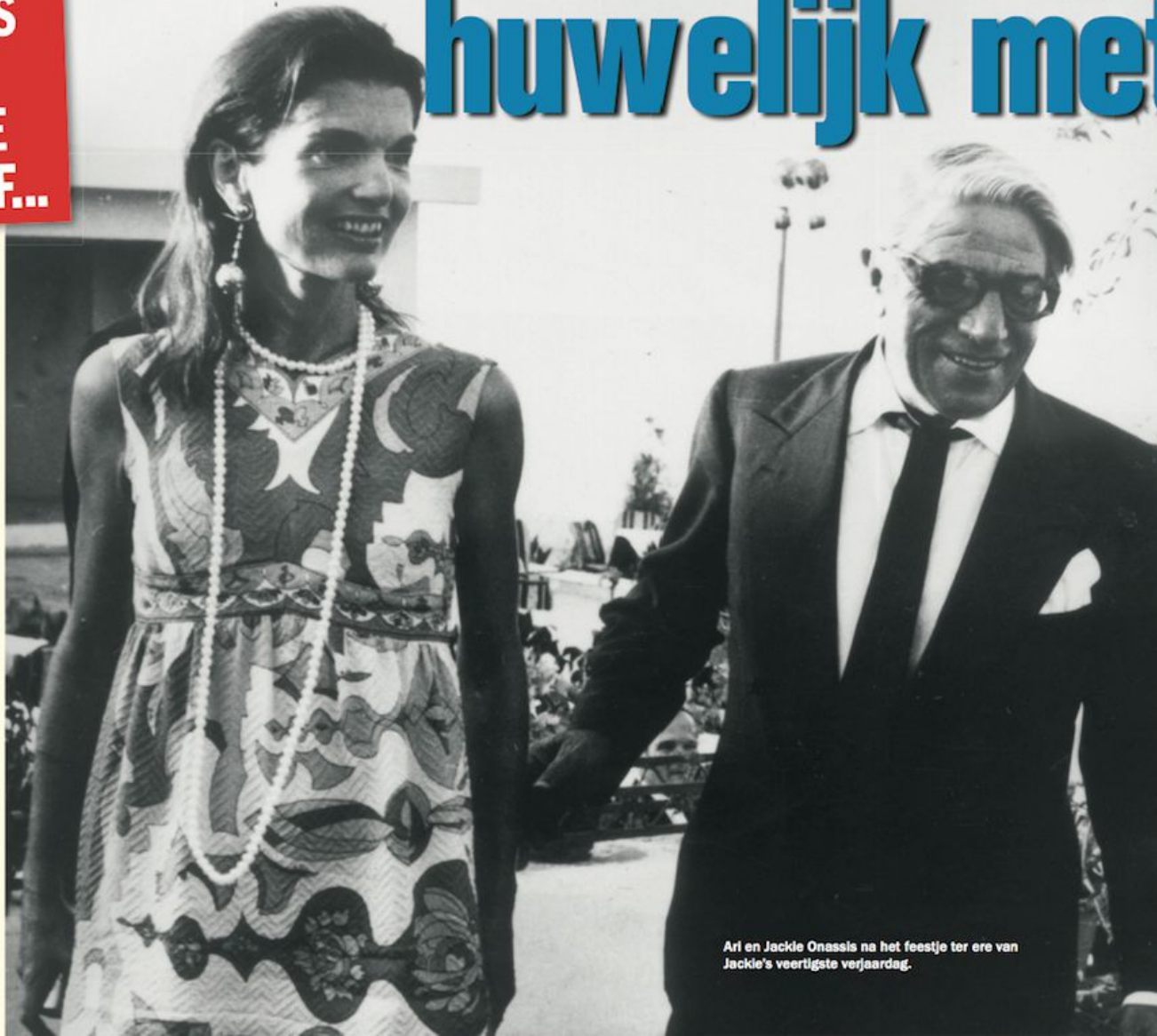
Ari en Jackie Onassis na het feestje ter ere van Jackie's veertigste verjaardag.

E en nieuw licht op een van de meeste bijzondere liefdesgeschiedenissen uit de vorige eeuw. In het kortgeleden verschenen boek After Camelot van J. Randy Taraborrelli wordt beschreven hoe de Kennedy's hebben onderhandeld met de Griekse miljardair Aristoteles Onassis over zijn huwelijk met de weduwe van de in 1963 in Dallas vermoorde Amerikaanse president. Het huwelijk van 39-jarige Jackie en de 62-jarige miljardair baarde destijds veel opzien. Niemand snapte hoe de populaire voormalige Amerikaanse First Lady