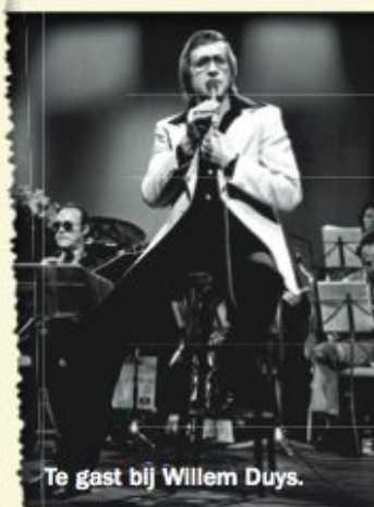
Te gast bij Willem Duys.

zagen hem weinig omdat hij vaak overwerkte. Daardoor heb ik de eerste tien jaren van mijn leven weinig met die man gesproken. Dat heb ik wel gemist, maar hij kon niet anders, er moest brood op de plank komen. Pas nadat hij met pensioen was gegaan, heb ik mijn vader écht goed leren kennen. Toen was hij vaak thuis en zong hij samen met ons liedjes om de tafel, speelde ik op de mondharmonica of voerde hij kleine conferences op. Toch was hij zelf het liefst nog langer doorgeslagen met werken. De reuma dwong hem echter een punt te zetten achter zijn loopbaan en het zware werk aan zijn zonen over te laten.'