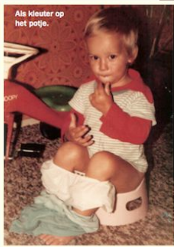
Als kleuter op het potje.