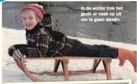
In de winter trok het gezin er vaak op uit om te gaan sleeën.