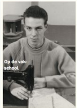
Op de vakschool.

dorp, later aan de boulevard aan zee. De oorlog lag inmiddels achter ons en wij konden er als kinderen lekker ravotten op het strand. En ik kon er heerlijk in de open lucht mijn turnoefeningen doen, want ik heb van mijn veertiende tot mijn negentiende geturnd." Strenge ouders had Frans niet. De kinderen werden vrijgelaten in hun keuzes, enkel de meest gebruikelijke regels werden gehandhaafd. Zo dekten de kinderen elke avond de tafel en poetsten ze het zilver. Verder wachtte het gezin netjes op elkaar tot iedereen zijn of haar bord leeg had voordat er buiten gespeeld kon worden. En daarbij was het: op tijd weer thuis zijn.