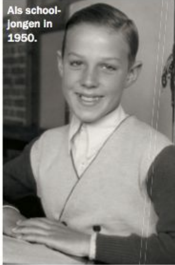
Als schooljongen in 1950.