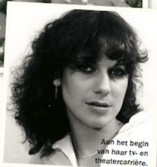
Aan het begin van haar tv- en theatercarrière.