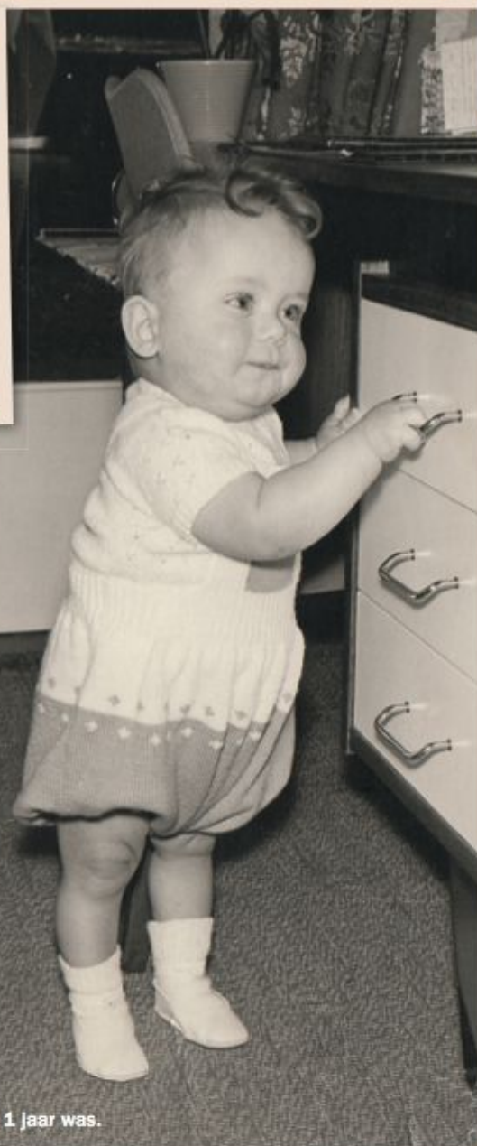
Bert toen hij 1 jaar was.

Inmiddels is Bert uitgegroeid tot een volwassen man en tot het gezicht van de EO dat ruzies en conflicten tussen mensen oplost. Met Het Familiediner brengt hij gebrouilleerde ooms, tantes, broers en zussen na jaren weer bij elkaar. Op 1 januari gaat de presentator zelfs een stapje verder door ook niet bloedverwanten het weer met elkaar te laten bijleggen. In de eenmalige nieuwjaarsshow Nederland Maakt Het Goed (20.25 uur, Ned. 1) zoekt hij ruziënde mensen op en brengt ze weer bij elkaar. Daarnaast behandelt Bert 'de tien grootste sorry's' en treden er artiesten zoals Xander de Buisonjé en Anita Meijer op, die zelf ook iets met iemand goed te maken hebben. Zelf is Bert ook wel eens over de schreef gegaan en dan nog wel met een politieagent. 'In mijn studententijd kreeg ik eens van een agent een bekeuring voor een kapotte knalpijp aan mijn auto, die ik de dag erna zou laten maken. Daar was ik zo pissig over dat ik een verkeerde naam en adres op gaf.