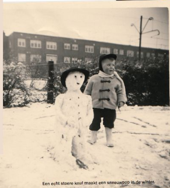
Een echt stoere knul maakt een sneeuwpop in de winter.

'Mijn pa liet me alles zelf ontdekken. Rijden in een auto of het kiezen van een opleiding, als ik dacht dat ik het aankon dan moest ik het volgens hem maar gewoon proberen. Hij trok vrijwel nooit aan de rem en liet me vrij in mijn keuzes. Hij was daardoor een enorme steun voor me. Hij heeft me vooral geleerd dat je af en toe in het diepe moet springen om iets te bereiken.' Zodoende stapte hij ook op zijn eer-