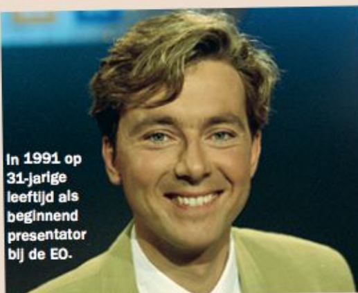
In 1991 op 31-jarige leeftijd als beginnend presentator bij de EO.