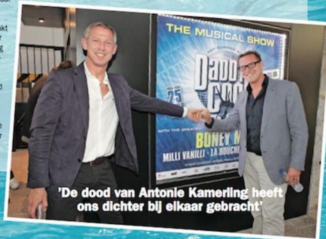
'De dood van Antonie Kamerling heeft ons dichter bij elkaar gebracht'